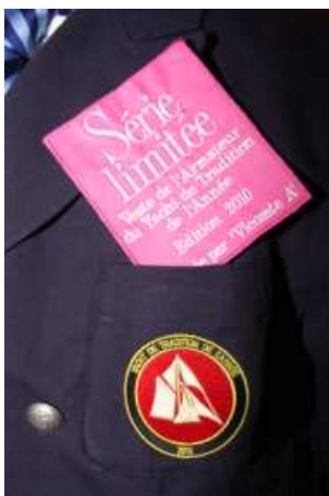
Blason de la veste créée par Vicomte A pour l'armateur du bateau élu