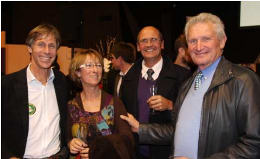
... et des tropéziens heureux