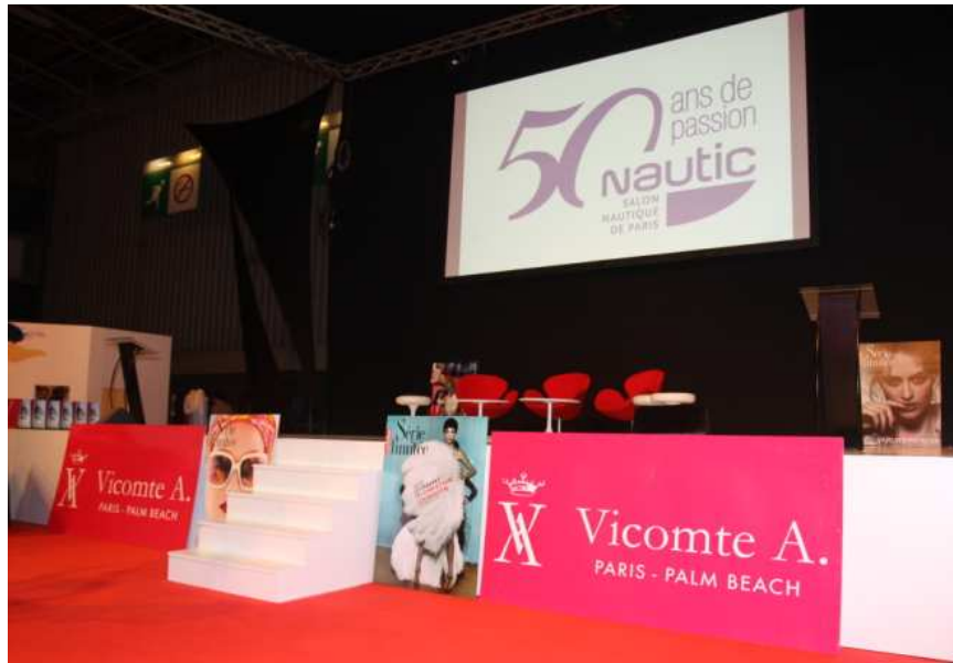
La Scène Nautic, avant le début de la cérémonie.