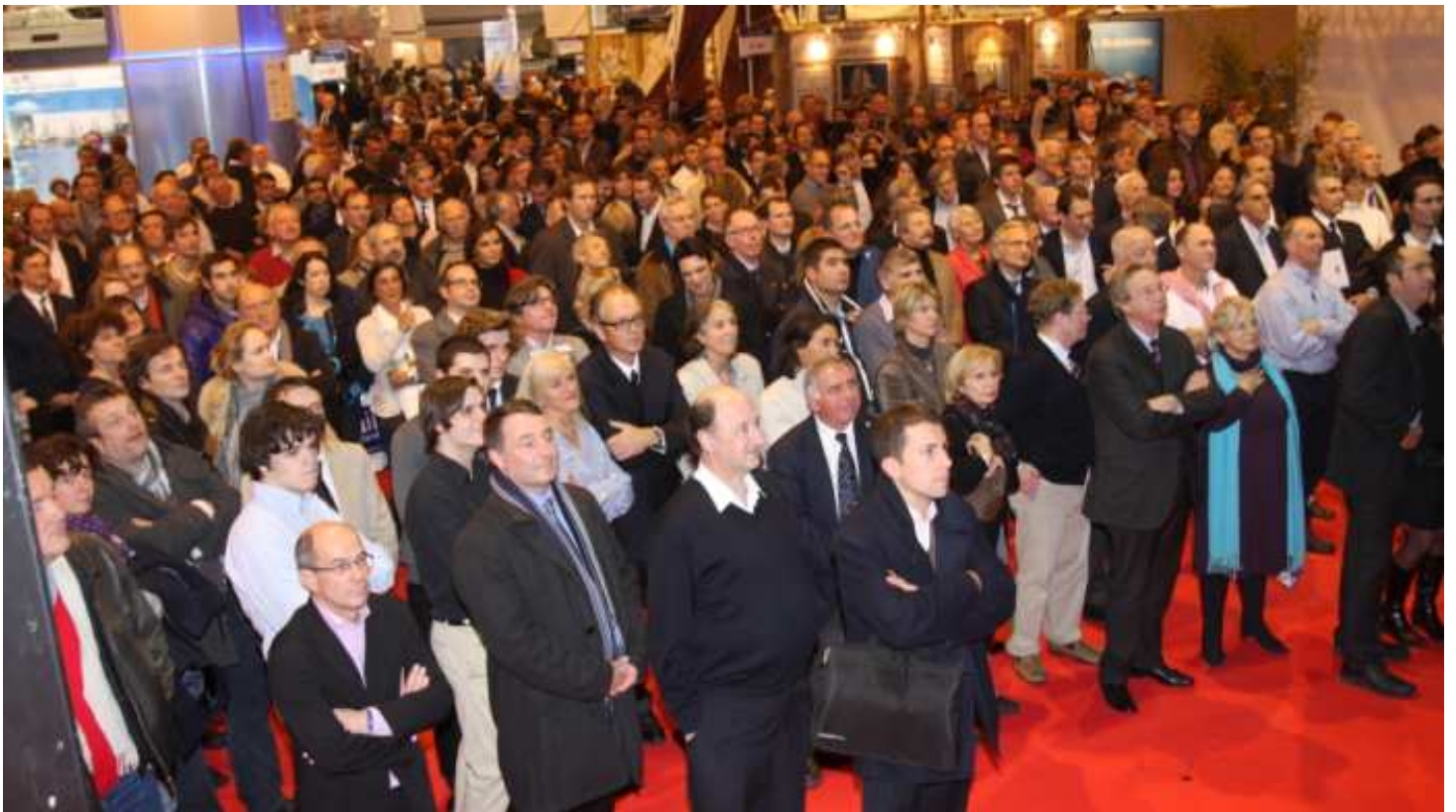
et une assemblée nombreuse (et de qualité)