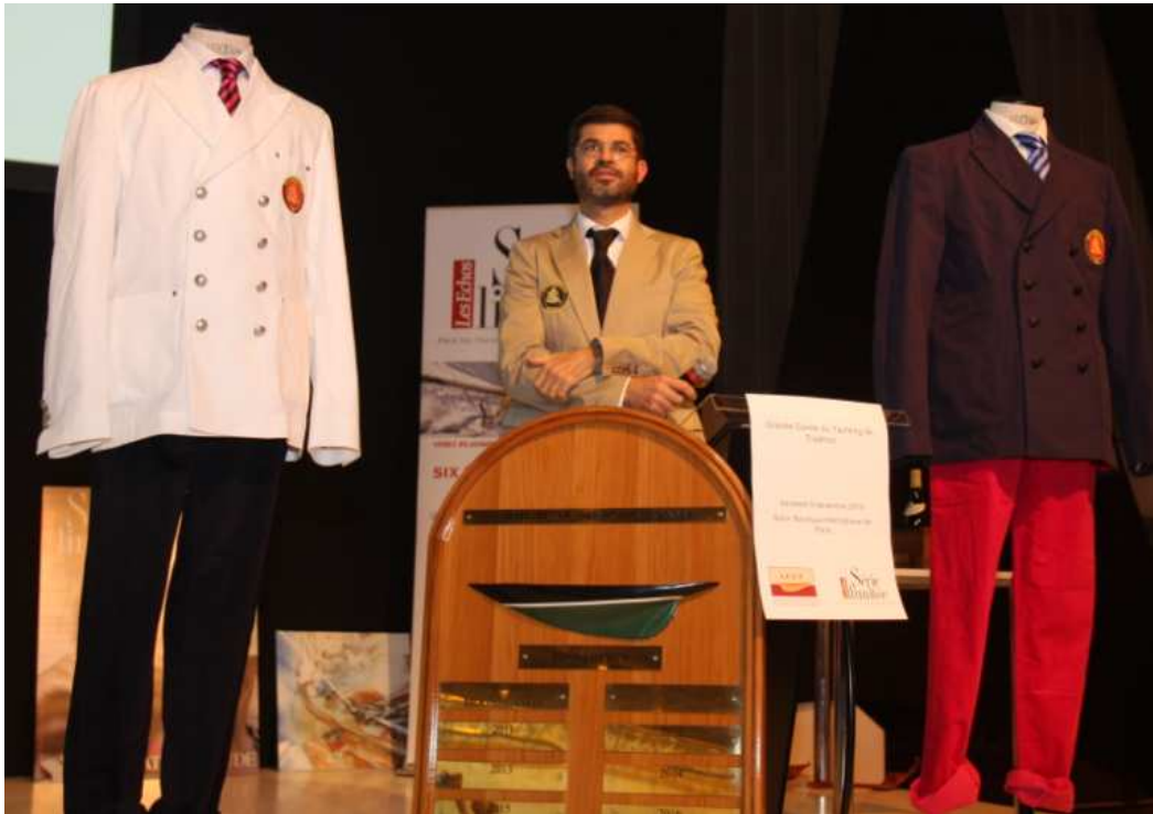
Remise du prix du Yacht de Tradition de l'année 2010 à BONA FIDE

Benoit Godeau, organisateur du Prix du Yacht de Tradition avec le trophée, entouré des vestes créées par Vicomte A., remet à l'armateur et au capitaine du bateau élu.